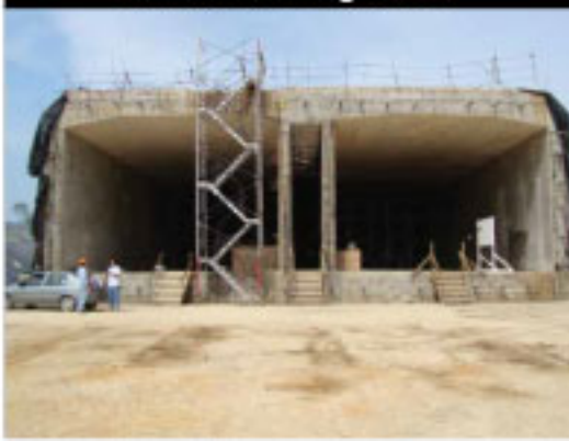
Inmersión de segmentos