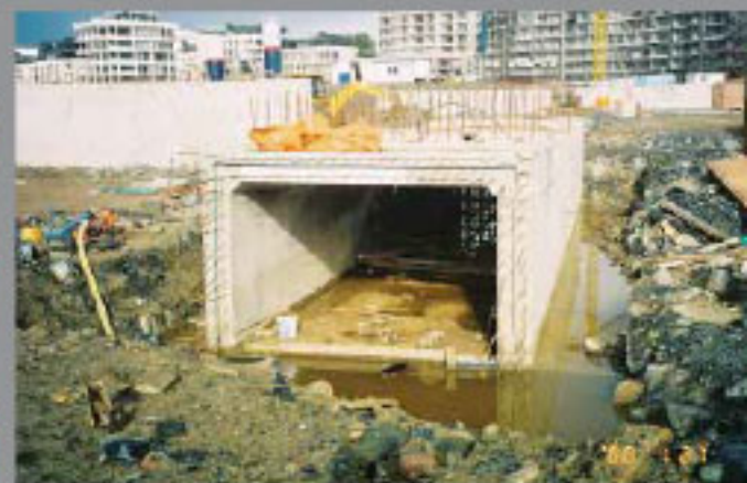
Túnel V&A, Sudáfrica

Localice un distribuidor Xypex en su país: