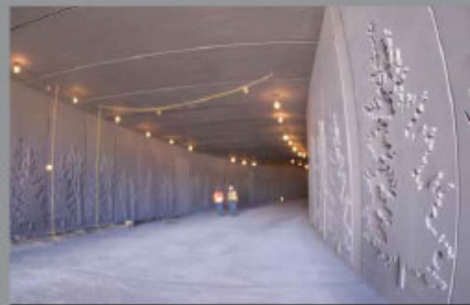
Túnel Bremerton, EUA