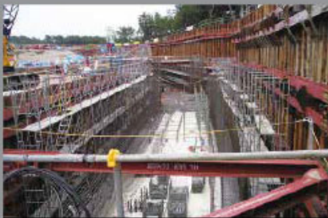
Túnel Synchroton, Japón