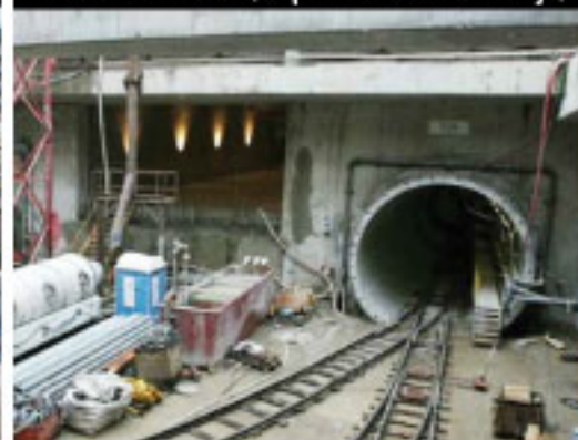
Cut-and-Cover (superficie hacia abajo)