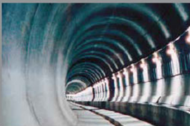
Metro de Ankara, Turquía