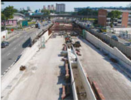
Cut-and-Cover (fondo hacia arriba)