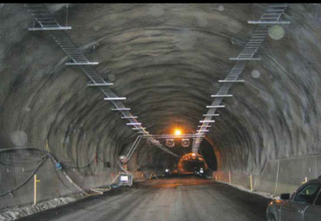
Túnel Vouli, Finlandia