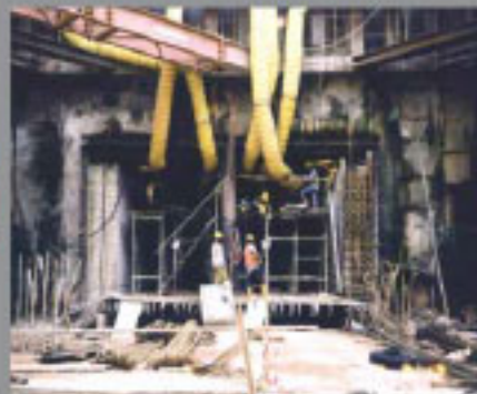
Concreto vertido en sitio