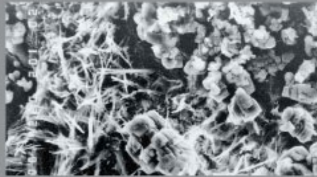
INICIO DE CRISTALIZACIÓN