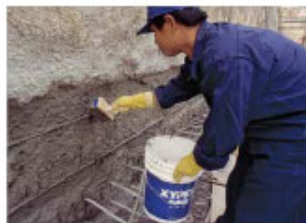
Recubrimiento Concentrado & Modificado

Los sistemas de recubrimiento y productos de reparación Xypex permiten que autoridades de transporte, ingenieros y contratistas puedan rehabilitar, de manera económica y confiada, estructuras que estén dañadas o presenten filtraciones, inclusive desde el lado negativo. Xypex Concentrado y Xypex Modificado se aplican como recubrimientos en forma de lechada a la superficie del concreto. Los productos Xypex (a diferencia de otros productos que necesitan aplicarse a un sustrato seco) necesitan de una superficie húmeda para ser aplicados – una condición típica de estructuras que presentan filtraciones. Este tipo de condiciones del ambiente no sólo son favorables, sino conductivas para que se lleve a cabo el proceso de Xypex por Cristalización. Los productos Xypex Patch'n Plug, Concentrado en Dry-Pac y Megamix están especialmente diseñados para reparar defectos del concreto permanentemente, tales como nidos/hormigueros, grietas estáticas y fallas en juntas frías y constructivas. Estos productos también son muy efectivos para el relleno de agujeros de sujeción.