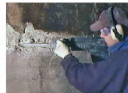
Rehabilitación Patch'n Plug & Megamix