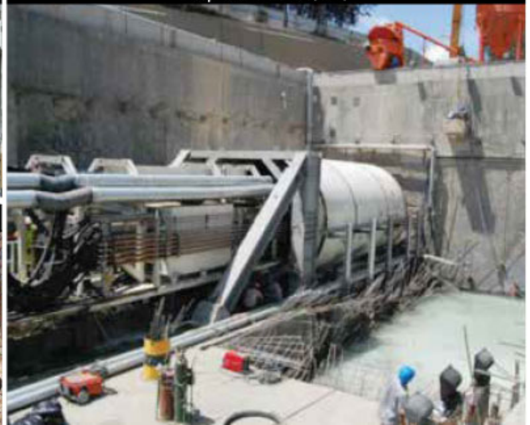
Máquina Tunneladora (TBM)