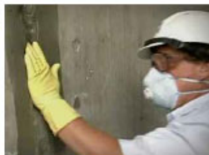
Taponeado Patch'n Plug