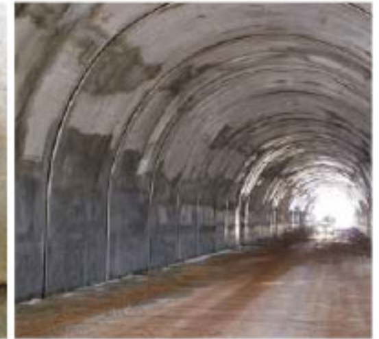
Filtración al interior de túneles